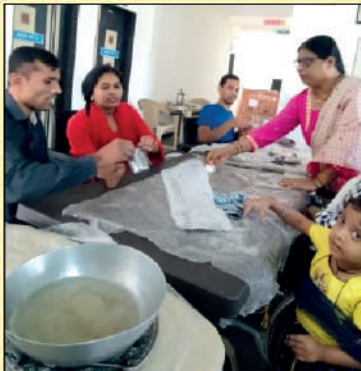
Instructor at work