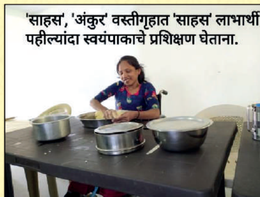
Learning cooking for the first time