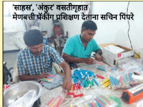
Finishing and packing the candles