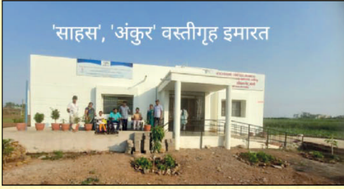
'Ankur' Rehabilitation Center at Nandni, Jaisingpur