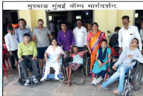
मुरबाड मुंबई कॉम्प मार्गदर्शन.