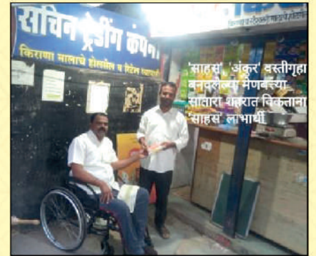
Marketing the candles