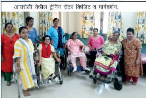
आयरोली येथील ट्रेनिंग सेंटर व्हिजिट व मार्गदर्शन.