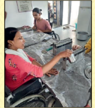
Pouring wax in moulds