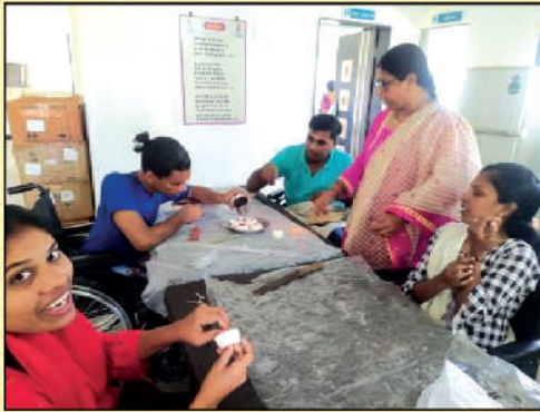
Learning is fun