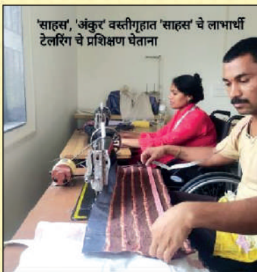
Learning stitching at Ankur