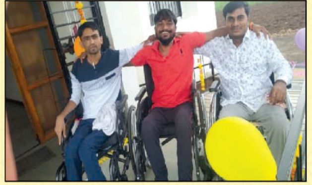
Happy trio at 'Ankur' Rehab Center