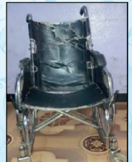
A worn out wheel chair replaced with a new wheel chair