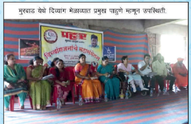
मुरबाड येथे दिव्यांग मेळाव्यात प्रमुख पाहुणे म्हणून उपस्थिती.