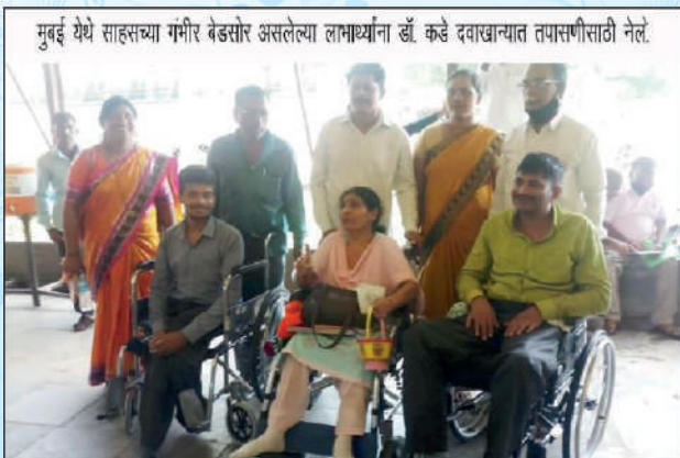
मुंबई येथे साहसच्या गंभीर बेडसोर असलेल्या लाभार्थ्यांना डॉ. कडे दवाखान्यात तपासणीसाठी नेले.